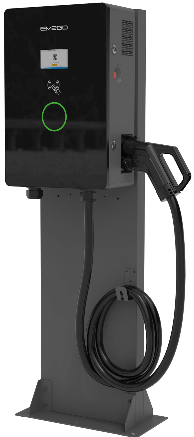
Säule optional erhältlich. Art. Nr.: EBU30-40-COMP